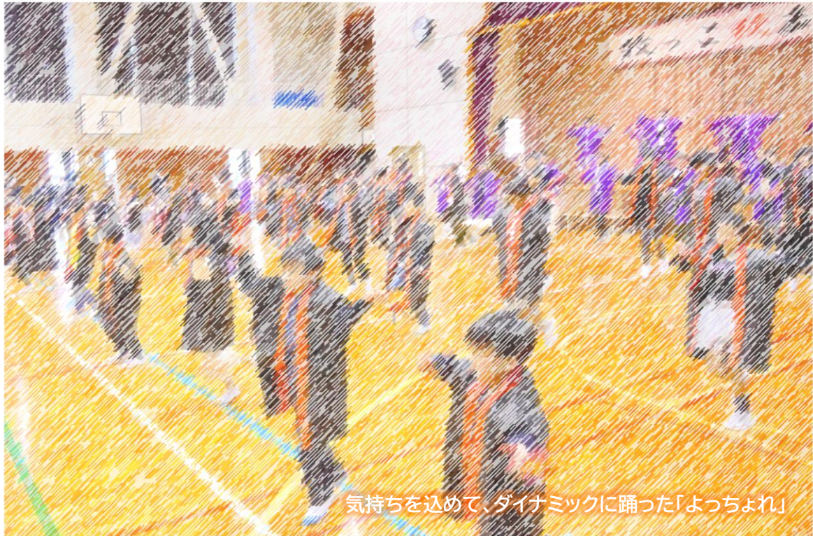
気持ちを込めて、ダイナミックに踊った「よっちょれ」

11月3日（木）に、3年振りとなる「牧っこ秋まつり」が開催されました。開会の挨拶でも話をしましたが、この「牧っこ秋まつり」には、牧区の住民総出で子どもだけでなく、大人も祭りを楽しもうとの願いが込められています。小中合同文化祭は、その中に位置付けられ、児童生徒の日頃の学習や活動の成果を総合的に発展させ、発表し合い、互いに鑑賞する場となっています。今年度は、どの学年も総合的な学習の時間、生活科で学んだことをストーリー性のある劇として発表しました。発表では、小規模校や複式学級の高さを生かして、一人一人に活躍の場があり、他学年との協働する場面がありました。発表を見たある方は「学習したことを掘り下げて、