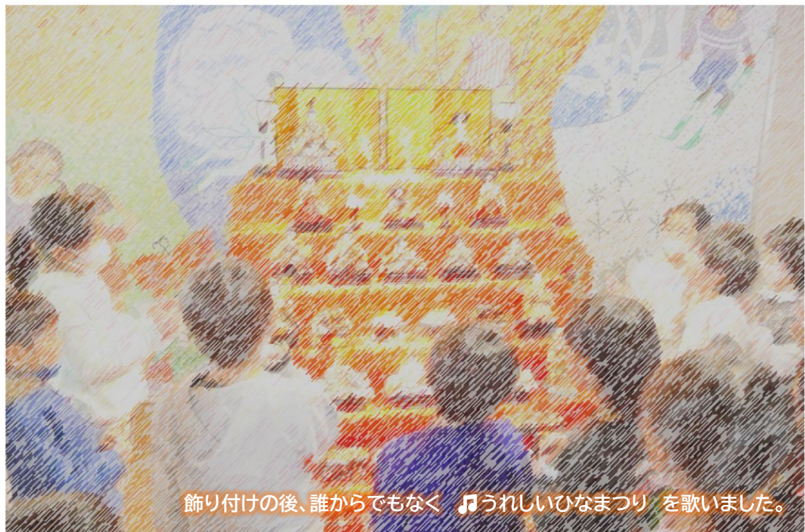
飾り付けの後、誰からでもなく ♪うれしいひなまつり を歌いました。

「昨年のリベンジをしよう」とよもぎの会代表様の一言で今年も牧小学校に立派なひな人形が飾られました。昨年は、コロナ禍にあり、子どもたちと一緒に飾り付けができませんでした。今年は、念願叶い子どもたちと一緒に飾り付けをすることができました。世代間交流は、その様子を見ていた者にとって、心温まる一場面でした。