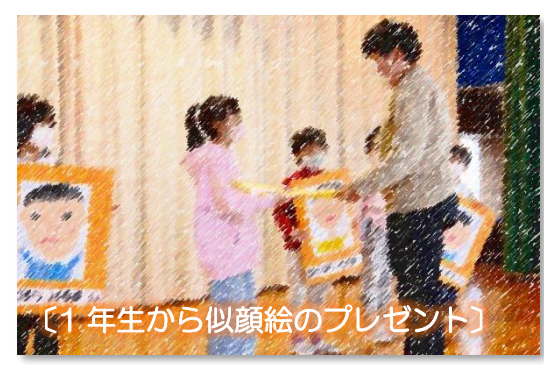
〔1年生から似顔絵のプレゼント〕