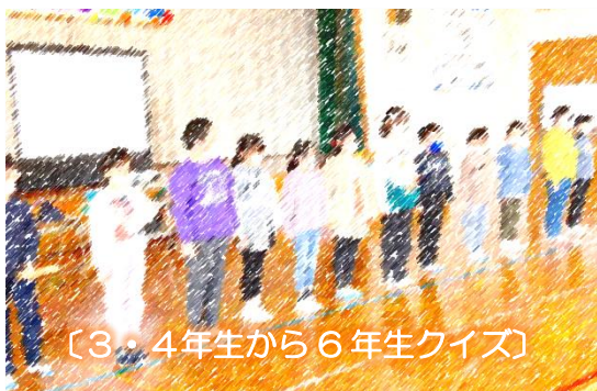
〔3・4年生から6年生クイズ〕

準備、運営を協力して行いました。6年生も1年生の時から写真から思い出が詰まったクイズを出し、感謝のメッセージを全校に伝えてくれました。最後に、5年生と2年生が掲げる花のアーチの中を退場しました。とても和やかで温かく、全校みんなで感謝を伝えられた会となりました。