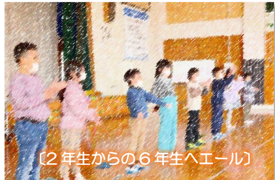
〔2年生からの6年生へエール〕