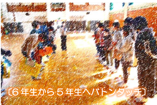
〔6年生から5年生へバトンタッチ〕