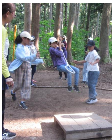
宿泊体験学習：5・6年生（6月） 国立妙高青少年自然の家で、自然の素晴らしさを感じていました。仲間との絆を深める体験活動やカレー作りを通して、自分から積極的に取り組むことや仲間と協力することの大切さを学びました。