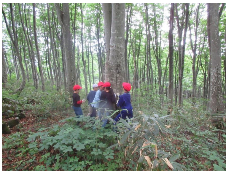
未来づくり講座：3・4年生（7月） ブナ林で自然の豊かさを体感しました。

子どもたちは、時には悔しい思いを経験しながらも、それを乗り越えて多くを学び、たくましくなってきました。子どもたちの健やかな成長のためにご支援、ご尽力くださった保護者、地域の皆様に感謝申し上げますとともに、2学期も、どうぞよろしく願いいたします。